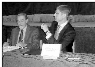
A hozzászólókat figyelve

Az ágazati, szakmai egyeztetésnek az információkhoz jutás is fontos terepe.